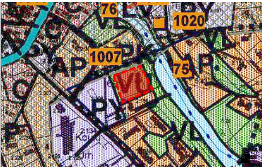
Kartta 5. Ote Virojoki-Vaalimaa osayleiskaavasta. Asemakaavan muutosalue punaisella.

Suunnittelualueella on voimassa Virojoki-Vaalimaa osayleiskaava , joka on hyväksytty kunnanvaltuustossa 20.6.2011 (§ 18). Suunnittelualue on osoitettu osayleiskaavassa julkisten urheilu- ja virkistyspalvelujen alueeksi (VU) . VU-alueella koskee kaavamääräys: ”Alueelle voidaan sijoittaa ulkoilua ja muita virkistyskäyttöä palvelevia rakennuksia.”