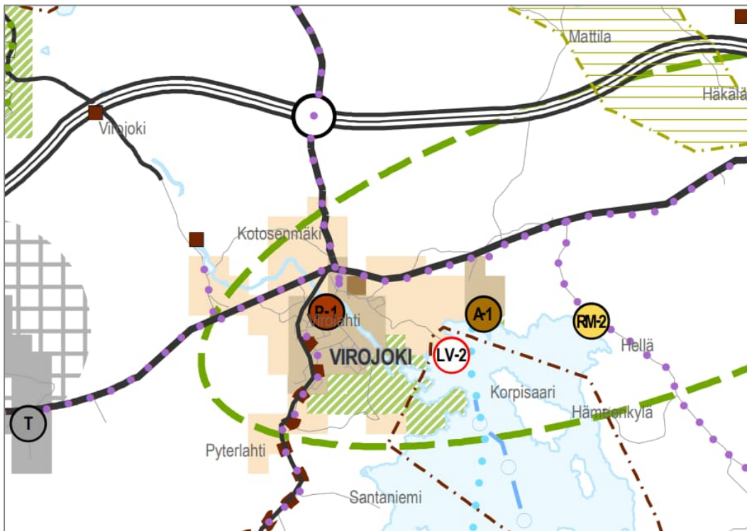
Kartta 6. Ote Kotkan – Haminan seudun strategisesta yleiskaavasta.

Museotien varteen on strategiseen yleiskaavaan merkitty seudullinen retkipyöräilyreitti (violetti palloviiva), joka on osa Euroopan laajuista pyörämatkailureittien verkostoa (EuroVelo).