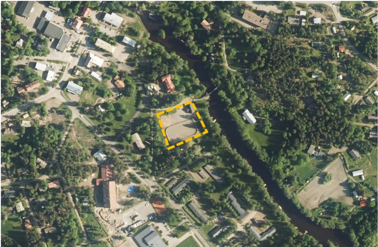
Kuva 1. Asemakaavamuutoksen sijainti ilmakuvalla.

Maakaasun hinnan voimakkaan nousun takia Virolahden kunta on selvittänyt Virojoen asemakaava-alueella sijaitseville kiinteistöille korvaavia lämmitystapoja. Selvityksissä ilmeni, että suurimpien kiinteistöjen, Villinrannan palvelukeskuksen ja kunnan koulukeskuksen edullisin lämmitysmuoto on hakelämpölaitoksen tuottama kaukolämpö. Laitoksessa varalämmönlähteenä toimisi polttoöljy, joka tarpeen tulleen tasoittaisi myös huippukuormaa.