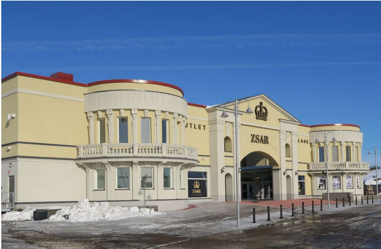
kuva Zsar Outlet Village